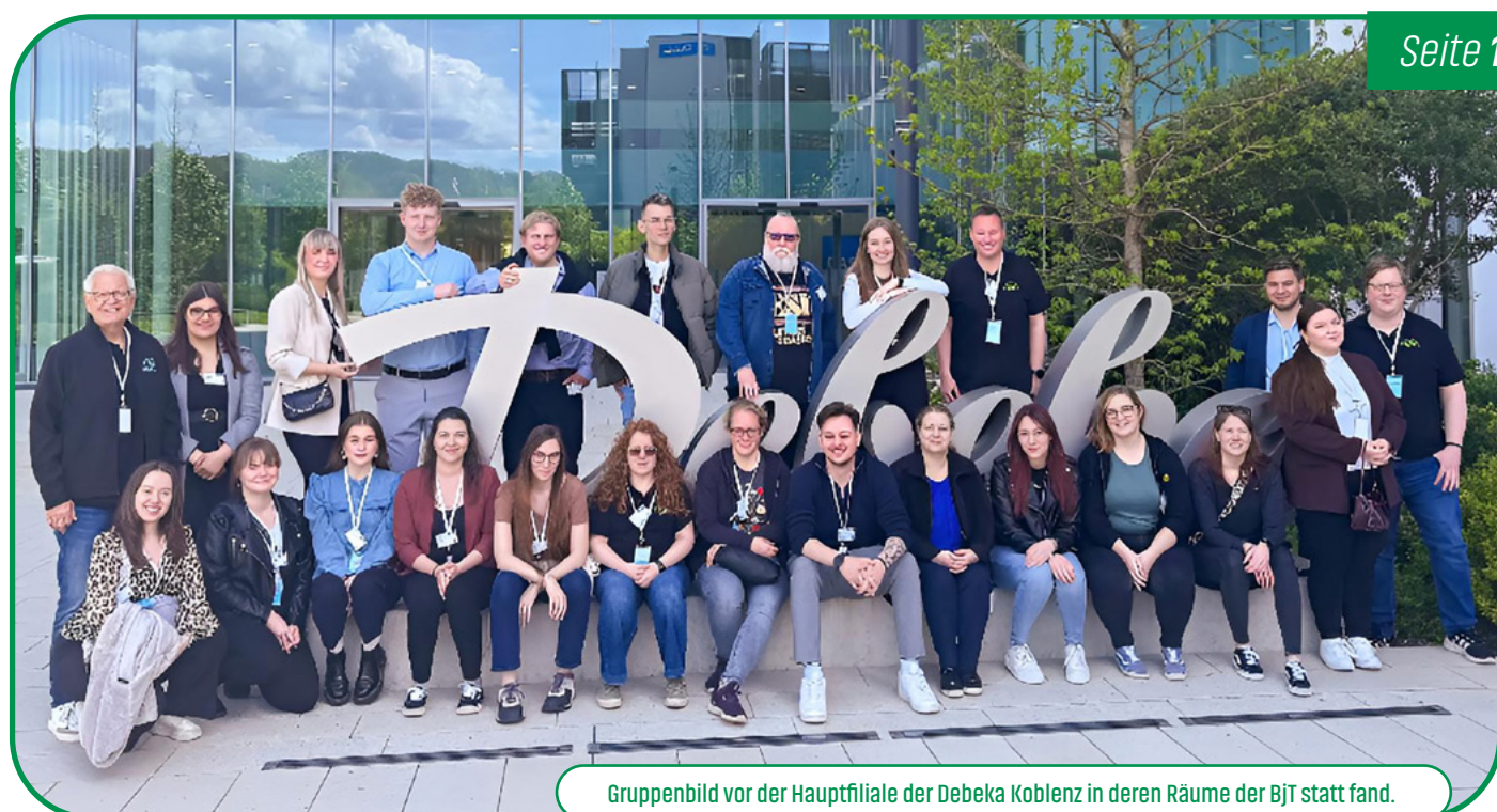
Gruppenbild vor der Hauptfiliale der Debeka Koblenz in deren Räume der BJT statt fand.