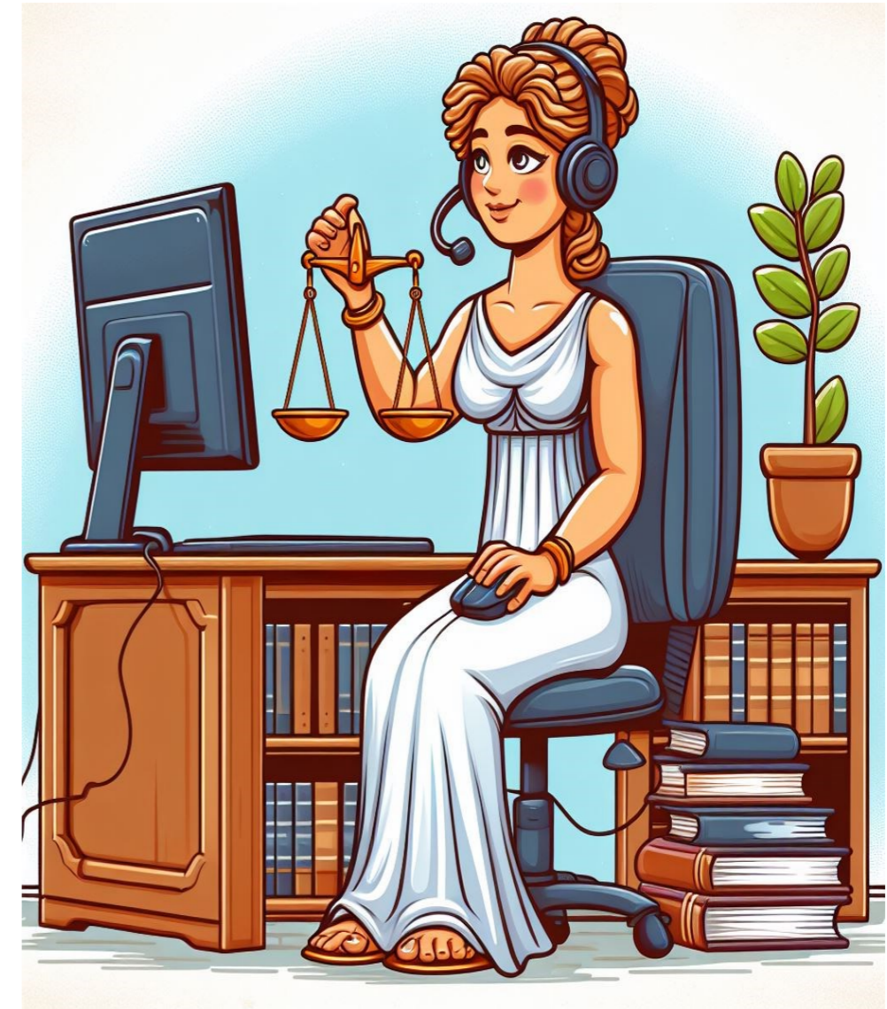
Mit KI DALL-E3 erstellt.